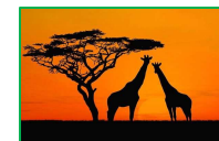
Tableau : Les ombres de la savane (Peinture)

Rallye autour du monde (Parcours motricité)